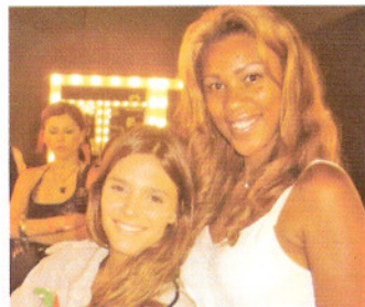
Fernanda Lima no camarim da grife NEON – São Paulo Fashion Week janeiro/ 2006